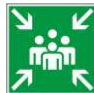
Bild: Flucht- und Rettungsplan erstellt durch die Fa. WHS Work Health & Safety

Fordern Sie ein unverbindliches Angebot an.